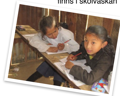
Snart kommer de att få en riktig skolbyggnad