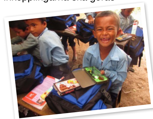
Glad pojke upptäcker vad som finns i skolväskan