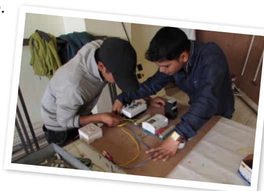
Instruktioner hur inkopplingarna ska göras

Vill du stödja arbetet använd gärna Nepals Vänner's girokonton; bankgiro 122-4708, plusgiro 656442-1