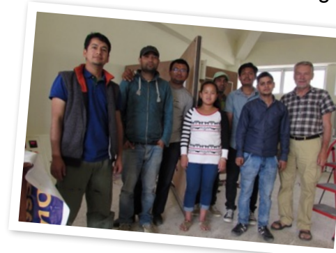
Peder med eleverna på industrielektriker utbildningen