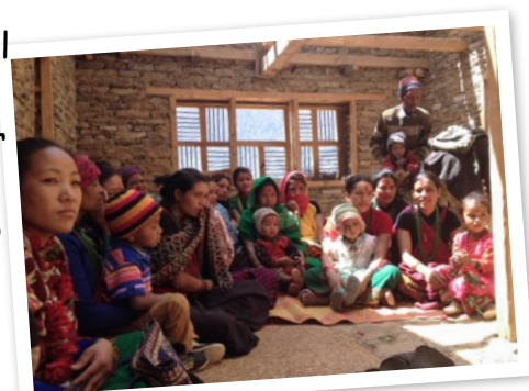
Självhjälpsgrupp i Thabang