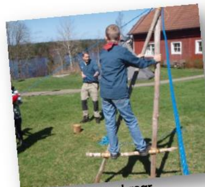
Vi bygger broar