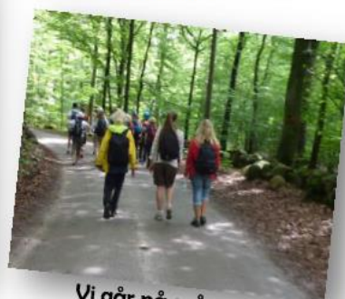
Vi går på spårning