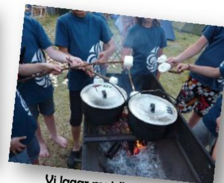
Vi lagar mat över öppen eld