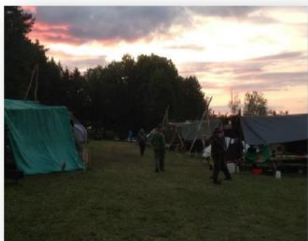
Vi åker på hajker och läger