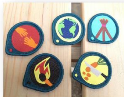
Vi får olika märken när vi har lärt oss om något speciellt