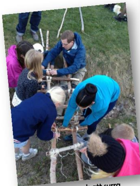
Vi lär oss knopar och att surra