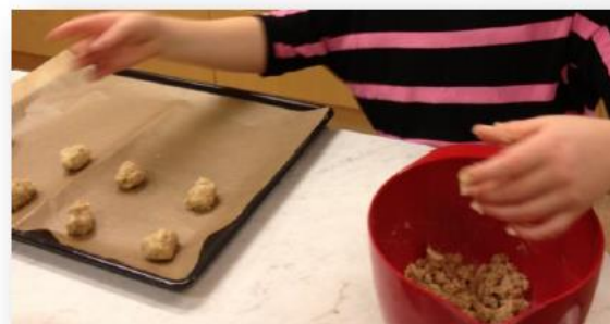
Vi bakar och provsmakar det vi gjort