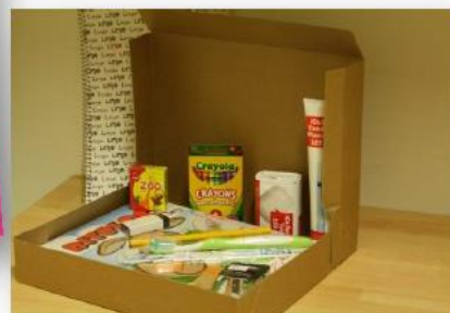
Vi skickar julklappar till barn i Östeuropa