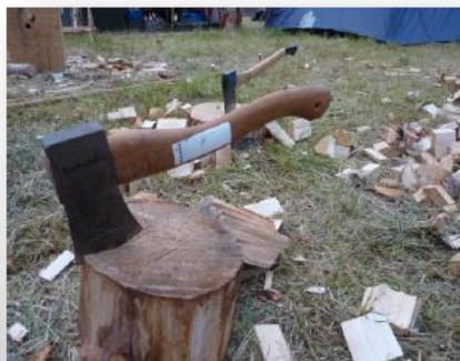
Vi lär oss använda kniv och yxa